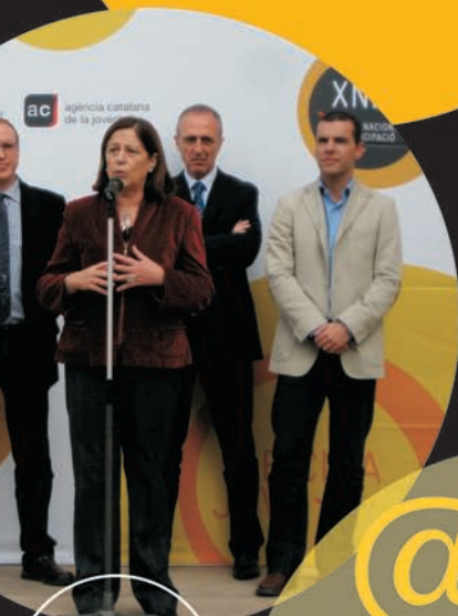
Inauguració de l'Oficina Jove de les Garrigues