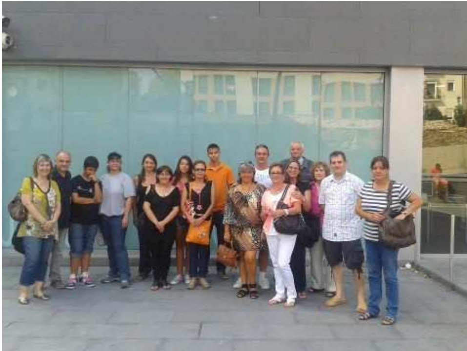
Grup de suport a una companya denunciada falsament- i absolta- a la darrera vaga general Jutjats Manresa a la sortida del judici. Juliol 2012

-tant a Manresa com a Berga s'ha intentat criminalitzar -sense èxit- l'acció dels nostres quadres i responsables , especialment en mobilitzacions generals